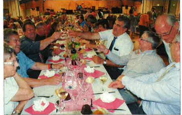
Les maires lèvent leur verre à l'amitié franco-allemande.

Vendredi 30 mai à 17 h 30, c'était l'ouverture de la cérémonie officielle du 10 e anniversaire du jumelage entre Breithem et Chatte avec le chant « Les Canuts » par le chœur d'hommes « Entrosol ». L'harmonie a interprété trois hymnes (italien, polonais et européen).