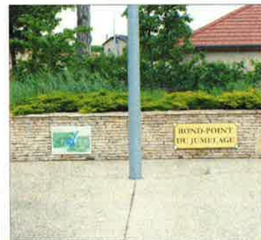
Le rond-point du jumelage où on se donnera rendez-vous samedi.

Durant quatre jours, 200 invités vont venir grossir la population de Chatte, à l'occasion du 10 e anniversaire du jumelage avec la ville de Breithem (Allemagne). Le 14 juillet 2012, Chatte s'était rendu à Breithem pour fêter le 10 e anniversaire, cette année, c'est le retour à Chatte. Les nombreux amis des deux communes se retrouvent à nouveau ici pour confirmer ensemble cette charte.