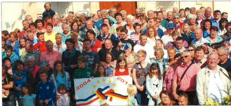
Sur le perron les places étaient chères !