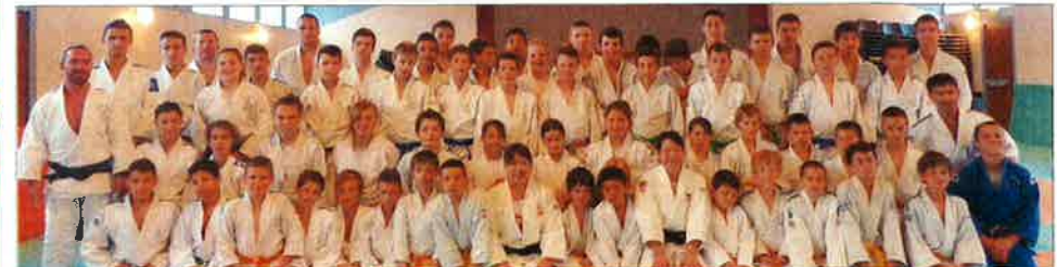
Lors du stage une cinquantaine de jeunes du club du Dajō romanais qui ont bénéficié des conseils de Ayumi Tanimoto, judokate japonaise, double championne olympique en 2004 et 2008, et de sa sœur, troisième mondiale de sa catégorie.

Durant la semaine à Vasieux-en-Vercors, ils ont préparé la fin de saison, un stage technique et d'oxygénation qui regroupait une cinquantaine de jeunes du club du Dajō romanais. Côte resu-