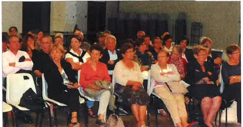
Une assistance studieuse.