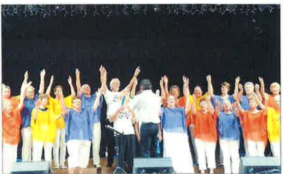
La chorale Lempischoeur.