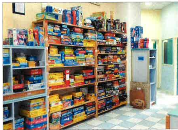
Jeux, jouets, déguisements, la Fête du Jeu se prépare à la ludothèque.

Dans le cadre de ses activités, la ludothèque et les associations de Saint-Marcellin organisent ce grand moment la Fête du jeu, dont la prochaine édition aura lieu le dimanche 15 juin, toute la journée, dans les jardins de l'Espace Saint-Laurent, ou en cas de pluie dans les salles toutes proches.