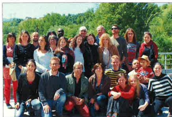
Le groupe international ayant participé à la matinée.

Pour plus d'information Alice Desbenoit. Tél. 04 76 38 07 20, Mail culture@sud-gresivaudan.org