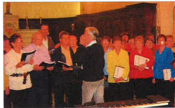
Belle prestation de "Tous ensemble" à Parnans.