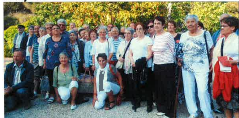
Des aînés qui voyagent.

Ce furent 5 journées de calme mais parfois haletantes, riches en découvertes et en souvenirs très agréables.