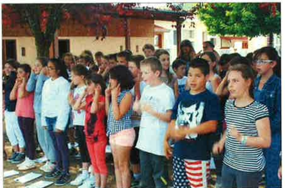
Tous les élèves réunis ont chanté "On est tous pareils".

Il est même resté du temps pour faire le bilan de la journée et de se prêter vers le deuxième étage : apporter le message à Chantesse.