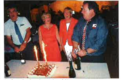
Le gâteau d'anniversaire avec les présidentes et les maires.