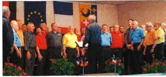
Les deux chœurs d'hommes.