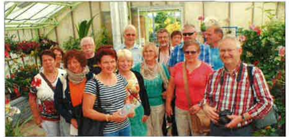
Photo en haut à gauche : les présidents des comités de jumelage ont assuré l'accueil des participants aux côtés des maires de Chatte et Breithem. En haut à droite : l'équipe chargée de la logistique. Et ci-dessus, lors des visites à la Galicière et au Plantau.

Jeu de société, après un bon repas partagé en familles (chez certaines de grandes tables) animé par de longues conversations où seule l'ambiance franco-allemande était le sujet, une bonne nuit a été appréciée pour récupérer des forces. À noter, que la compréhension dans les conver-